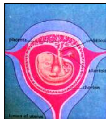
Rajah 1: Bahagian rahim yang mempunyai janin dan ia bersambung dengan plasenta ke dinding rahim (Encyclopedia of the Animal World 1982).

Dalam zoologi, plasenta merupakan organ dari jisim tisu lembut yang melekat pada janin. Ia mempunyai ciri penting iaitu terdapat dua sistem peredaran darah yang dimiliki oleh janin dan induk di mana kedua-duanya saling merapati antara satu sama lain tetapi mengalir secara berasingan mengikut saluran darah masing-masing. Peredaran darah janin disambungkan kepada plasenta melalui saluran-saluran darah seperti umbilical vein ; saluran darah yang membawa masuk oksigen darah daripada plasenta kepada janin dan umbilical arteries ; saluran darah yang membawa keluar oksigen darah daripada janin. Manakala peredaran darah induk disambungkan kepada dinding rahim melalui saluran darahnya sendiri seperti maternal vein dan maternal artery .