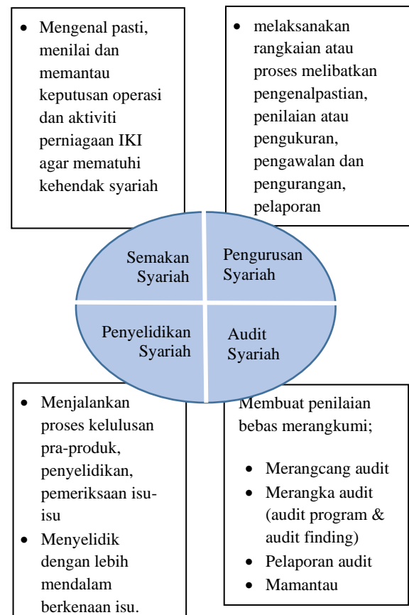
Rajah 2: Peranan pegawai Syariah dalam pematuhan Syariah

kajian ini. Secara amnya, semakan syariah marangkumi keseluruhan operasi perniagaan IKI termasuk proses pengembangan produk yang bermula dari pengstrukturkan produk sehingga penawaran produk (Mustafa et al. 2020). Perannya dalam pematuhan syariah ialah mengenal pasti, menilai dan memantau keputusan operasi dan aktiviti perniagaan IKI agar mematuhi kehendak syariah. Pengurusan risiko syariah merupakan unit yang penting dalam pamantuhan syariah. Pegawai yang bertanggungjawab perlu melaksanakan rangkaian atau proses melibatkan pengenalpastian, penilaian atau pengukuran, pengawalan dan pengurangan, dan akhir sekali pelaporan. Audit Syariah juga memainkan peranan yang untuk membuat penilaian secara bebas. Pegawai syariah yang menjalankan peranan tersebut perlu membuat perancangan audit Kerangka audit ( audit program & audit finding ) dan pelaporan audit serta memantau operasi berdasarkan perkara yang dinyatakan dalam audit finding. Penyelidikan Syariah pula berperanan untuk menjalankan proses kelulusan pra-produk, penyelidikan, pemeriksaan isu-isu dan menyelidik dengan lebih mendalam berkenaan masalah tersebut. Rajah 2 merupakan rumusan terhadap peranan pegawai syariah dalam memastikan pematuhan syariah.