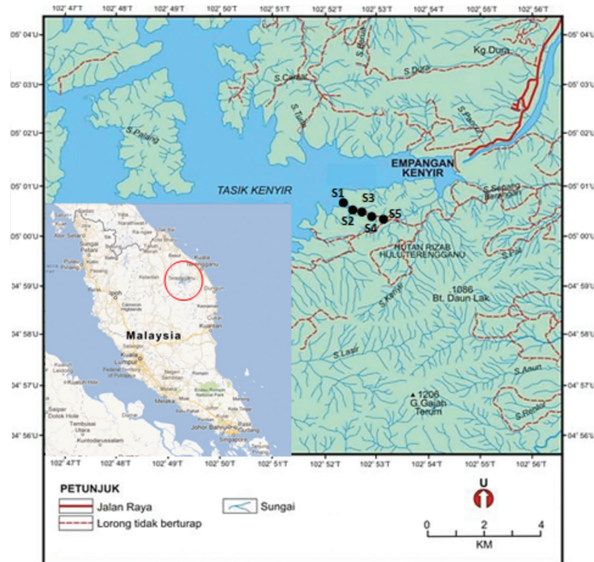
RAJAH 1. Peta kawasan persampelan di Sungai Ikan, Hulu Terengganu, Terengganu

persampelan, manakala ujian CCA telah dilakukan untuk melihat pengaruh persekitaran terhadap kehadiran dan sebaran makroinvertebrat bentik. Ujian korelasi pula dilakukan bagi mengenal pasti taksa makroinvertebrat bentik yang berpotensi dijadikan agen penunjuk biologi di kawasan kajian.