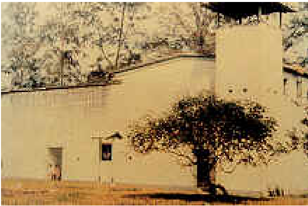
Balai Polis Bukit Kepong hari ini. (sekarang Pondok Polis)