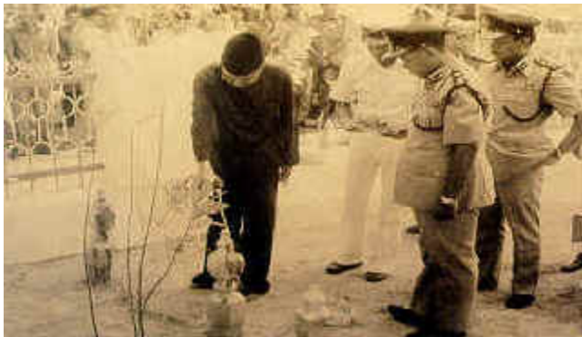
Y.B. Tan Sri Ghazali Shafie, Menteri Hal Ehwal Dalam Negeri Sewaktu melawat Bukit Kepong pada 23 Feb. 1976 sedang menyiram air mawar di pusara anggota polis Bukit Kepong yang terkorban