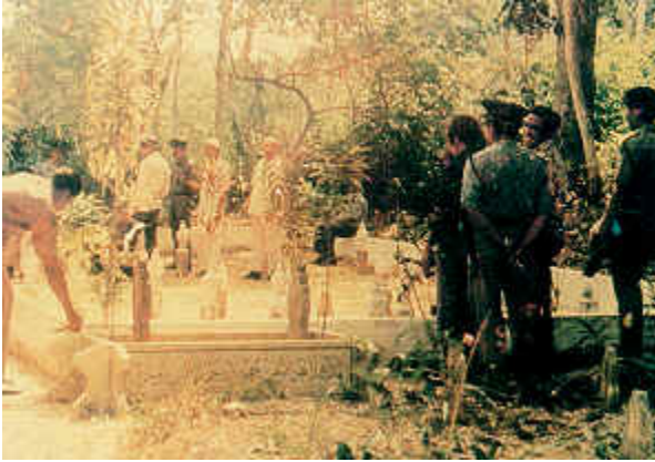
Sebahagian daripada anggota polis yang melawat ke pusara anggota polis Bukit Kepong yang terkorban