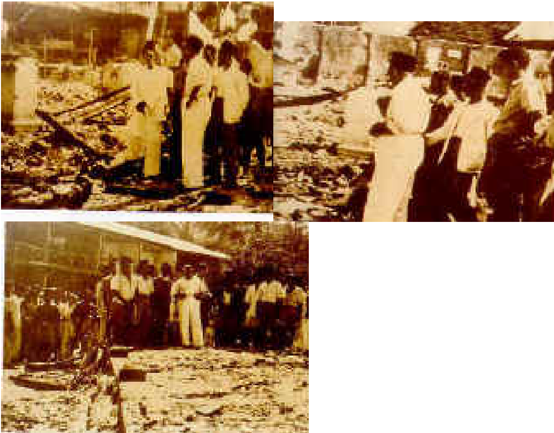
Dato'Onn Jaafar (Menteri Besar Johor) sedang memeriksa tempat kejadian selepas serangan balai pada 24 Februari 1950

Dalam detik terakhir pertempuran hebat itu, komunis membakar berek pegawai dan stesen polis. Dua wanita dan anak-anak mereka terbakar hangus dalam berek pasangan kawin. Pada ketika itu hanya 3 orang polis dan seorang pengawal kampung yang masih hidup. Mereka meluru keluar dari stesen yang terbakar dan menyerbu kedudukan komunis, membunuh sekurang-kurangnya tiga dari mereka. Pihak komunis terus menembak mereka yang cuba lari daripada balai polis yang sedang terbakar itu. Hanya seorang sahaja berjaya menyeberangi sungai dengan rifle masih di tangannya. Ketika ini penduduk kampung Durian Chondong disebelah barat menghantar bot ke Lenga untuk memberitahu pihak berkuasa mengenai serangan ini.