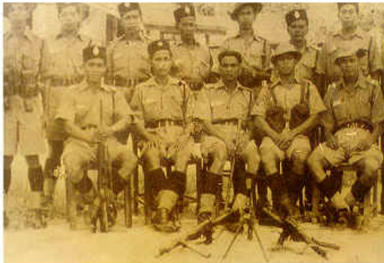
Anggota polis pangkat rendah dan polis bantuan bergambar di hadapan Balai Polis Bukit Kepong sebelum diserang

Pasukan Polis bantuan ini bekerjasama rapat dengan pasukan polis Bukit Kepong. Tiga orang daripada mereka sedang bertugas seperti biasa semasa Balai Polis Bukit Kepong diserang oleh segerombolan penganas komunis (180 orang) lebih kurang jam 5.00 pagi, 23 Februari 1950. Pertahanan balai polis dan berek kelamin serta merta didirikan untuk menghadapi serangan hebat daripada penganas komunis yang menggunakan senjata-senjata automatik yang mengepung balai polis. Tembak-menembak berlaku dengan sengitnya, dan pihak penganas komunis mengarahkan supaya anggota polis