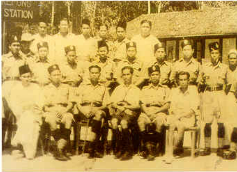
Gambar kenangan anggota polis Bukit Kepong sebelum peristiwa serangan balai pada 23 Febuari 1950

melarikan diri. Dalam pertempuran yang lain, pengawal kampung yang terdiri daripada 40 orang polis bantuan dan beberapa kumpulan bersenjatakan parang telah diberi penghargaan 'Colonial Police Medals' ke atas keberwiraan mereka.