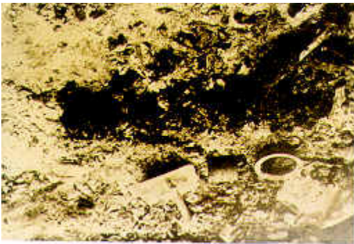
Kawasan balai menjadi "padang jarak padang terkukur" angkara kekejaman musuh

Pertempuran di Bukit Kepong merupakan suatu kekalahan dari segi fizikal tetapi memberi suatu kemenangan dari segi mental dan semangat perjuangan. Pasukan yang kecil bilangannya bersemangat dan kecekalan dalam mempertahankan maruah mereka dari tipu daya penganas komunis supaya menyerah diri walaupun terpaksa berhadapan dengan musuh yang 10 kali ganda kekuatan daripada mereka. Pihak penganas komunis juga mengalami kecederaan yang banyak. Ini ialah kemenangan bukan hanya untuk menyelamatkan diri sendiri dan keluarga, sahabat handai tetapi kepada negara dan bangsa. Anggota-anggota polis boleh menyelamatkan nyawa mereka dan keluarga mereka dengan menyerah diri tetapi mereka sedar bahawa mereka berjuang kerana perkara yang lebih penting dari nyawa mereka. Mereka berjuang untuk menyelamatkan tanah air mereka dari dijajah oleh penganas Komunis. Semoga Allah akan mencucuri rahmatNya ke atas roh-roh mereka.