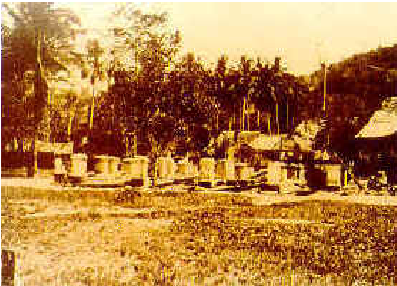
Tapak Balai Polis Bukit Kepong yang dibakar oleh penganas komunis

Dalam mempertahankan balai polis Bukit Kepong, 17 orang anggota telah terkorban.