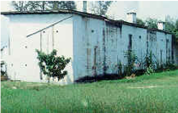
Pandangan belakang Balai Polis Bukit Kepong hari ini