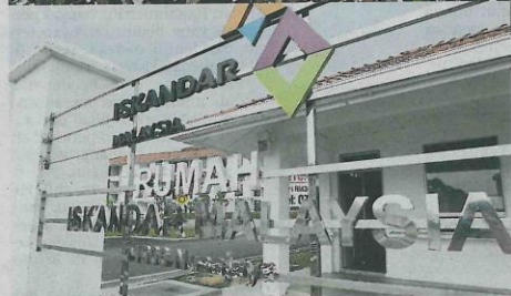
Wilayah pembangunan Iskandar.

menuntut kepada satu bentuk dan model pengurusan perbandaran yang baru kerana sifatnya yang begitu kompleks untuk diuruskan dengan menggunakan model dan bentuk pengurusan bandar sedia ada.