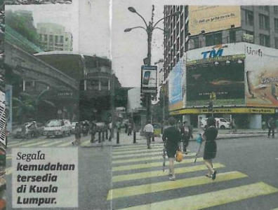
Segala kemudahan tersedia di Kuala Lumpur.