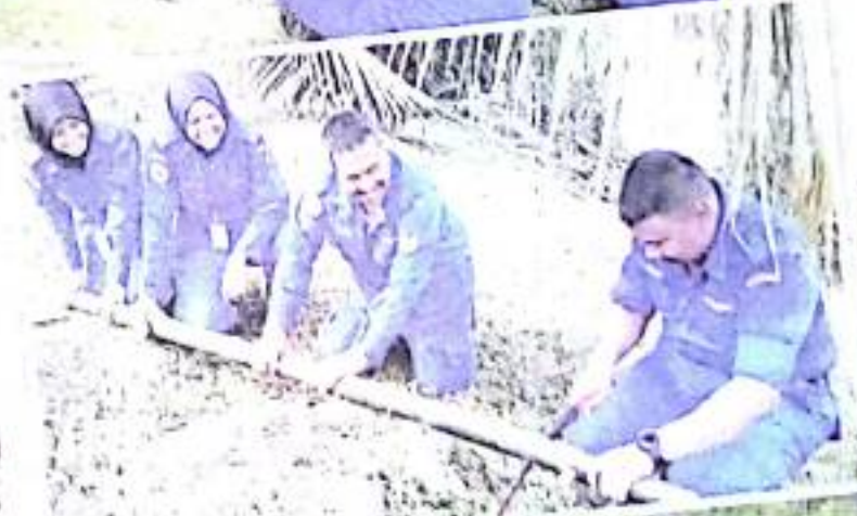
Peserta diajar cara memotong buluh sebelum memasaknya ketika keadaan darurat.