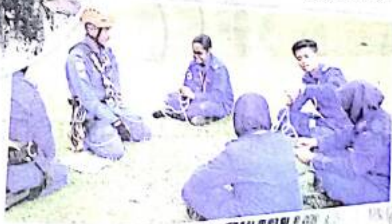
Peserta diajar cara menyelamatkan mangsa di bangunan tinggi.