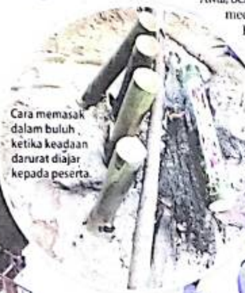
Cara memasak dalam buluh ketika keadaan darurat diajar kepada peserta.

"Selain itu, program ini mampu memberi banyak manfaat dan kelebihan kepada setiap pegawai kadet siswa dengan pendedahan awal mengenai persediaan dan cara bagaimana mengukuhkan ikatan dalam sesebuah organisasi di samping lebih berdisiplin dan mampu menerapkan perasaan sehati dan sejiwa antara semua kompeni," katanya.