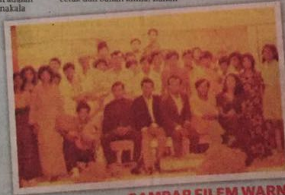
GAMBAR FILEM WARNA mula bertapak sekitar tahun 1969

Tambahan dengan kewujudan kamera pada telefon bimbit yang mampu menyaingi kamera sebenar maka etika perlu dijaga agar kita tidak terjebak dengan budaya tidak baik.