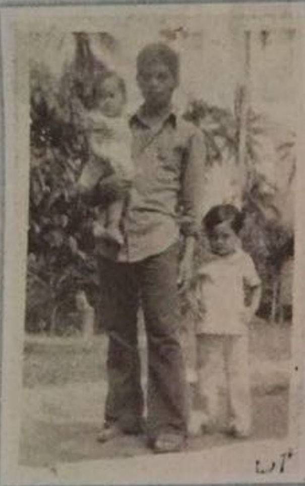
GAMBAR HITAM PUTIH adalah media pertama yang hadir di negara kita

Dengan kepesatan dan kecangihan fotografi digital, kita tidak boleh abaikan etika serta tatasusila kita jika memuatkan gambar-gambar di mana.