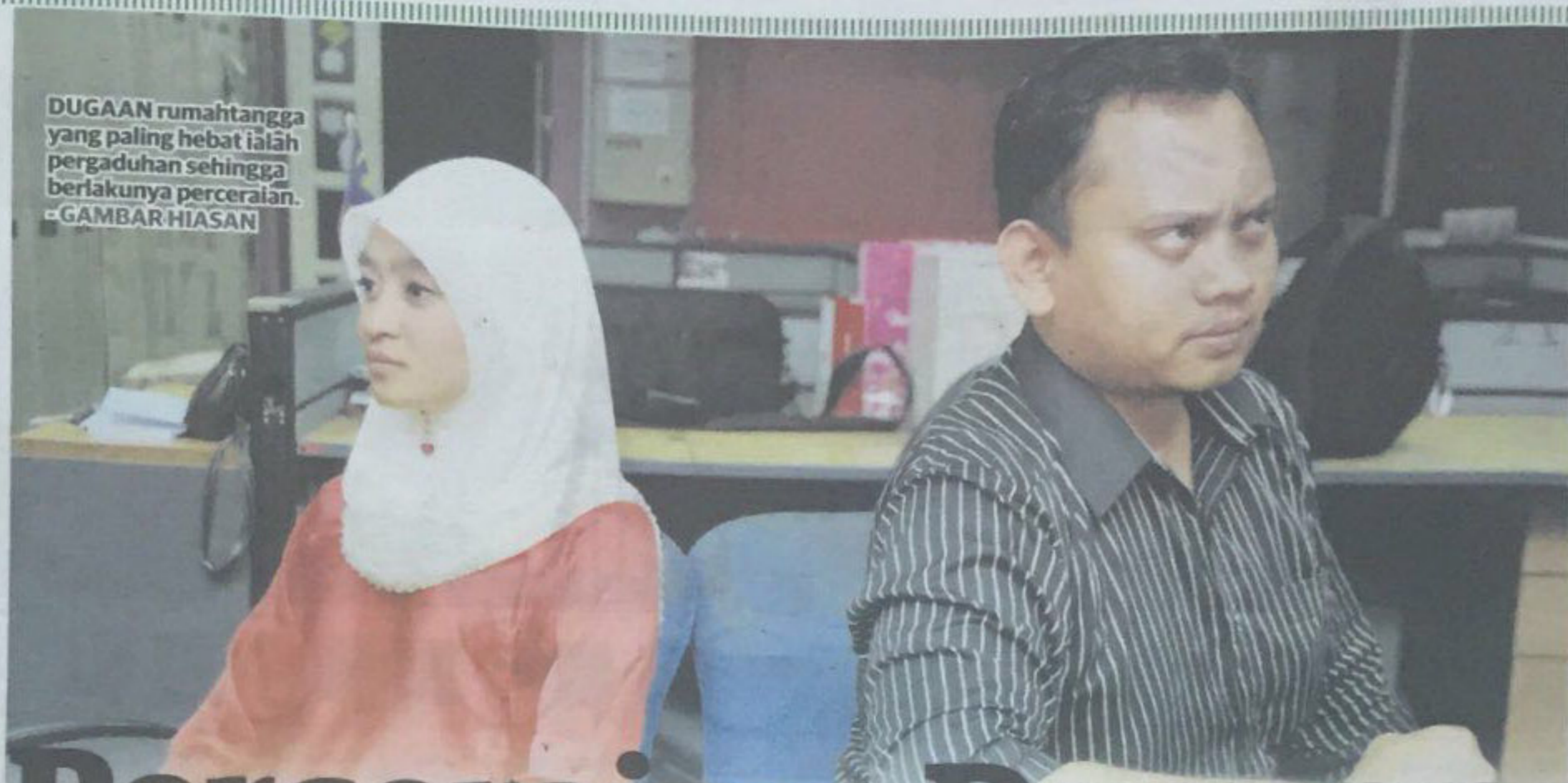
DUGAAN rumahtangga yang paling hebat ialah pergaduhan sehingga berlakunya perceraian. - GAMBAR HIASAN

Akibatnya terdapat pasangan menderita bertahun-tahun kerana terlepas kata! Ada pasangan yang tercabar