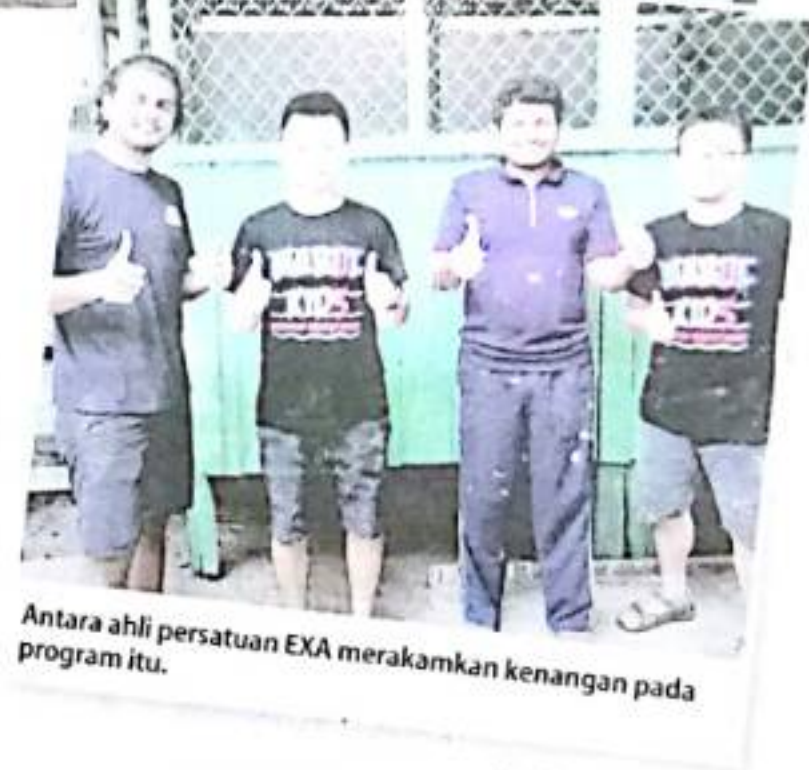
Antara ahli persatuan EXA merakamkan kenangan pada program itu.

P ersatuan Ekspansi Amal (EXA) yang terdiri daripada 10 pelajar program Master in Business Administration (MBA) dari Universiti Kebangsaan Malaysia (UKM) mengadakan program Mabul Kids Education 2018, baru-baru ini.