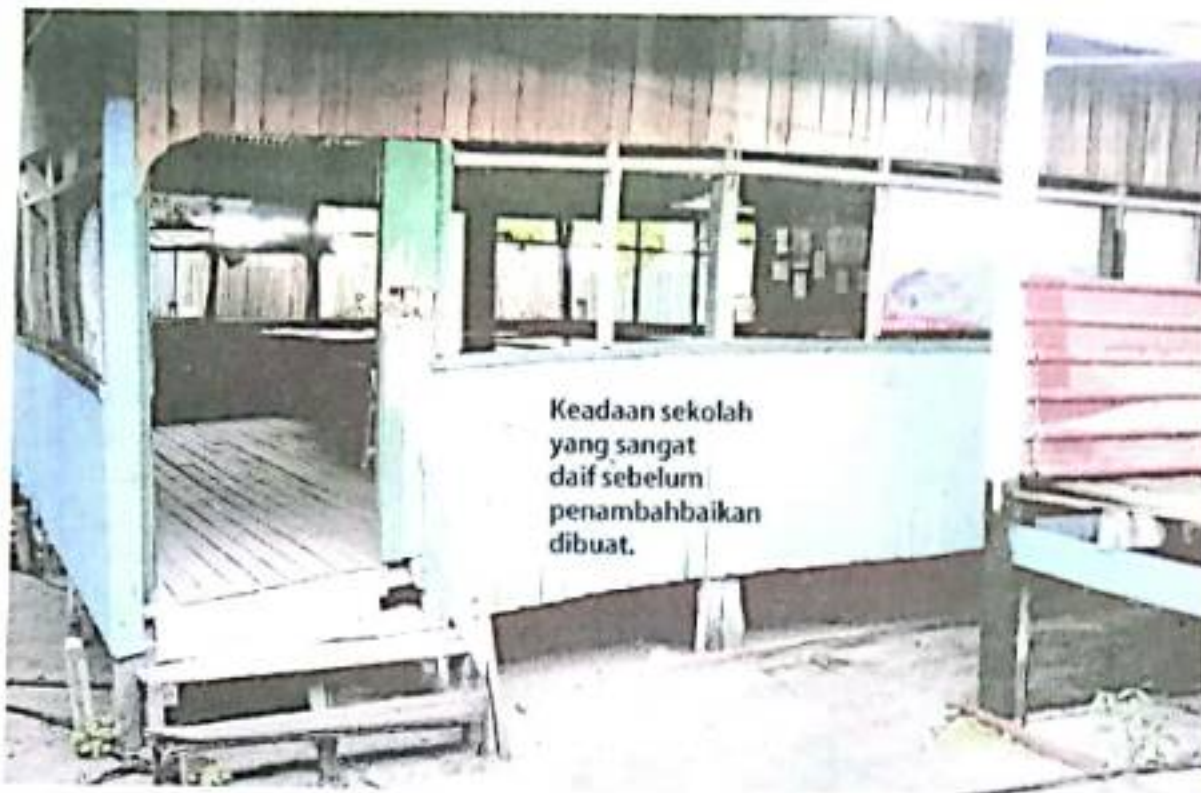
Keadaan sekolah yang sangat daif sebelum penambahbaikan dibuat.