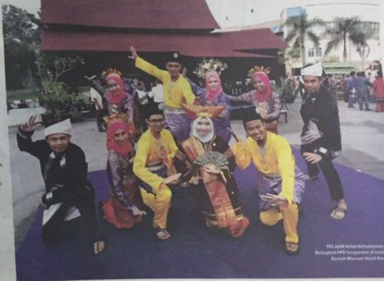
PELAKSAR Kuala Khatulistiwa Seri Balinghian PPD bergambar di hadapan Rumah Warisan Hajah Kundur

sokongan Pertubuhan Pendidikan, Sains dan Kebudayaan Pertubuhan Bangsa-Bangsa Bersatu (UNESCO). "Projek ini hasil penyediaan 18 pelajar dan enam penyarah urusan seni bina yang mengambil masa lima bulan sejak Oktober tahun lalu." "Mereka memilih Rumah Warisan Hajah Kundur kerana memiliki ciri istimewa golongan bangsawan di negeri ini pada satu ketika dulu." "Projek ini juga kerjasama pelbagai pihak antaranya Lembaga Museum Negeri Sembilan dan Majlis Agama Islam Negeri Sembilan (MAINSI)," katanya.