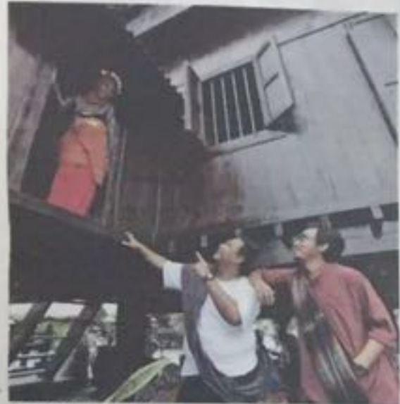
KERJA memasang semula memelan belanja RM130,000 ditanggung UNESCO.