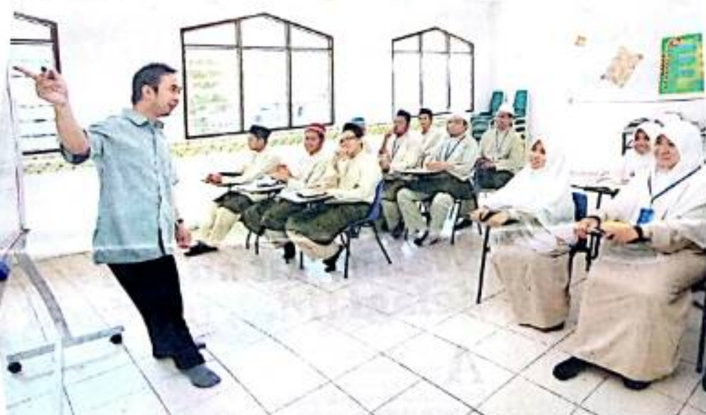
NASIB guru dan bakal guru tahfiz perlu dibela supaya mereka tidak dianggap golongan kelas kedua dalam arus pendidikan negara. - GAMBAR HIASAN.