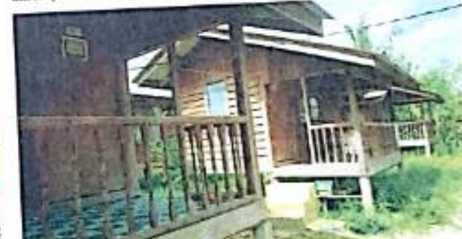
ERA masa kini tidak boleh lagi mengetepikan aspek kemudahan asas pelajar dalam pembangunan mental dan fizikal mereka. - GAMBAR HIASAN.

"Isu guru tersebut amat penting dalam mekanisme membangunkan sesebuah pendidikan berkualiti kerana merekalah golongan pelaksana," katanya.