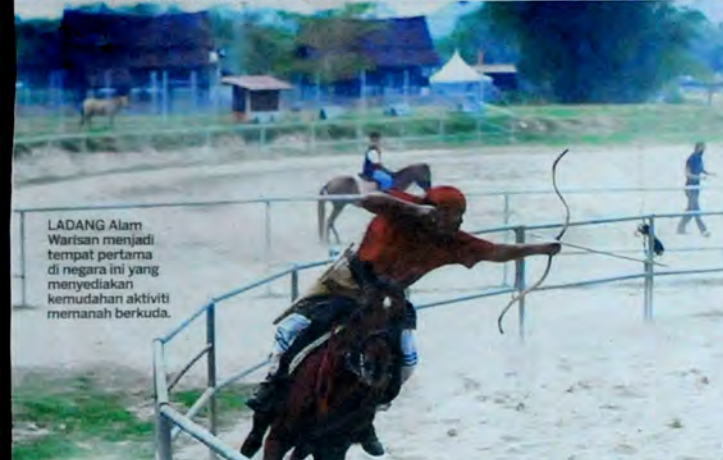
LADANG Alam Warisan menjadi tempat pertama di negara ini yang menyediakan kemudahan aktiviti memanah berkuda.