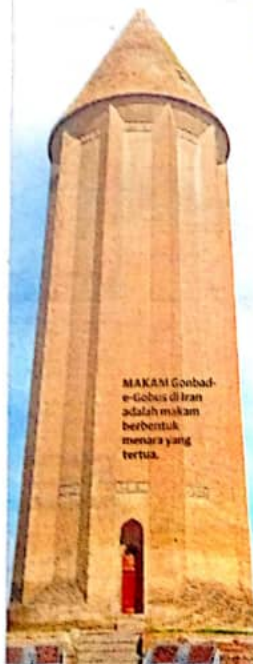
MAKAM Gonbad-e-Gabus di Iran adalah makam berbentuk menara yang tertua.