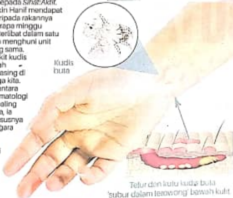
Telur dan kutu kudis buta 'sujur dalam terowong' bawah kulit

PARASIT boleh menyebarkan kudis buta mudah merabak.