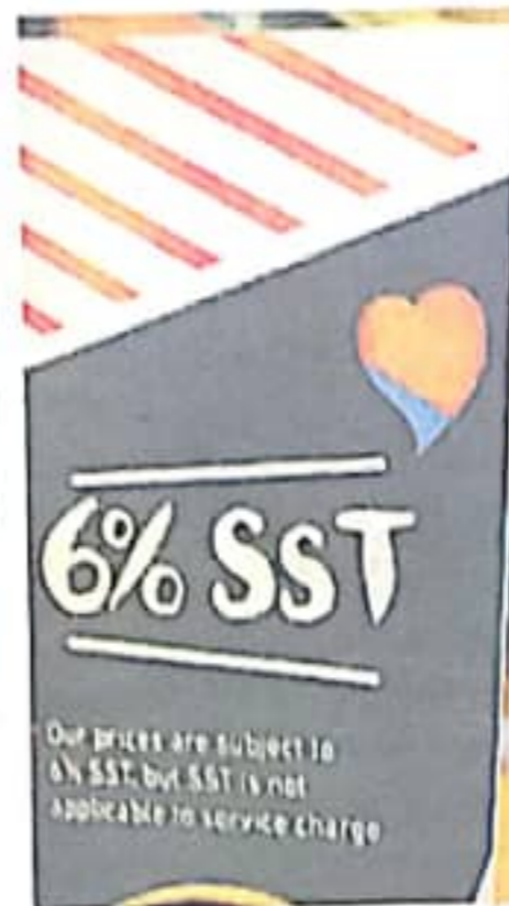
Cukai SST diperkenalkan kerajaan pada 1 September 2018 bagi menggantikan GST.

"Saya terus membantah GST (Cukai Barang dan Perkhidmatan), tapi saya rasa SST sendiri banyak kekurangan