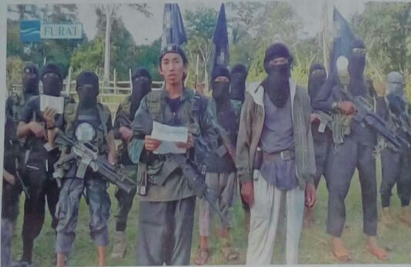
KUMPULAN militan Abu Sayaf tidak gentar membuat ancaman terhadap mana-mana pihak termasuk melakukan penculikan dan serangan. - GAMBAR HIASAN

Mohamed al-Owhali, salah seorang pengebom bunuh diri di Nairobi, pengeboman kereta api Mumbai pada Julai 2006 dan perpindahan wang dari Sweden ke militan di Iraq contohnya dibiayai menggunakan sistem ini. Malah, terdapat syarikat tertentu di Asia Barat yang memindahkan lebih AS$26 juta (RM115.18 juta) kepada kumpulan pengganas. Selain itu, Dubai sebagai antara pusat kewangan dunia turut digunakan kumpulan pengganas untuk pelbagai aktiviti 'halal' dan haram.