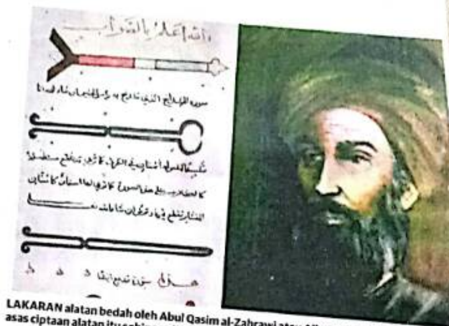
LAKARAN alatan bedah oleh Abul Qasim al-Zahrawi atau Albucasis telah menjadi asas ciptaan alatan itu sehingga hari ini. - GAMBAR HIASAN

"Apakah kita tidak ingat kepada sumbangan al-Biruni dalam membuktikan bahawa matahari merupakan pusat alam dan bumi mengelilinginya,