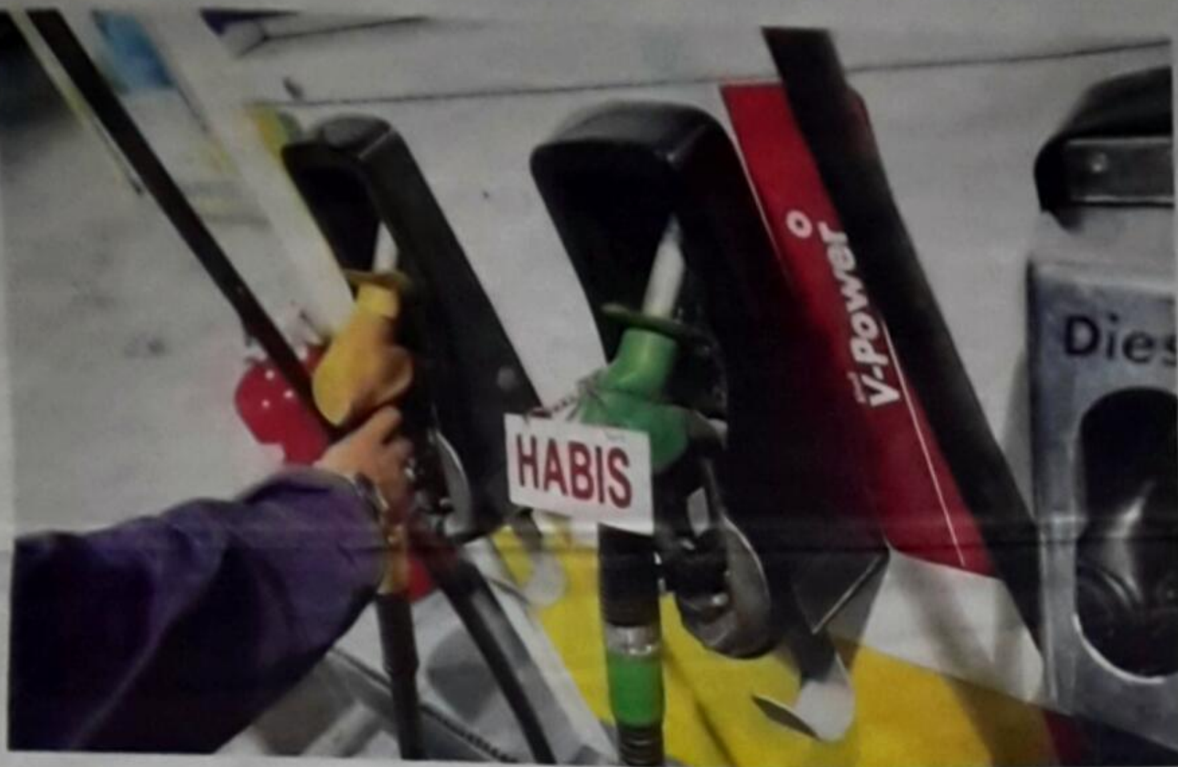
PENGURANGAN pengeluaran minyak secara kolektif sebanyak 10 peratus tahun ini memberi kelegaan besar kepada dunia. - Gambar hiasan