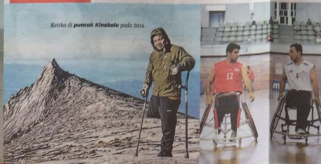
Ketika di puncak Kinabalu pada 2014.

Kawasan mudah mengalami kanser tulang Kawasan jarang dikesan mengalami kanser tulang