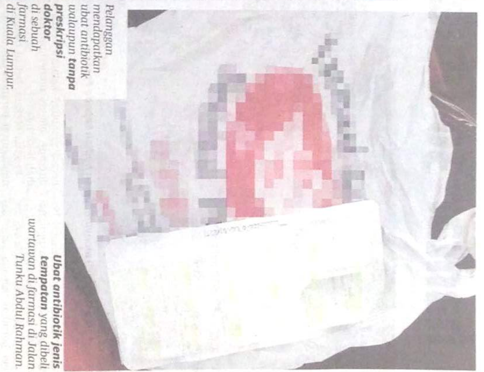
Pelanggan mendapatkan ubat antibiotik walaupun tanpa preskripsi doktor di sebuah farmasi di Kuala Lumpur.