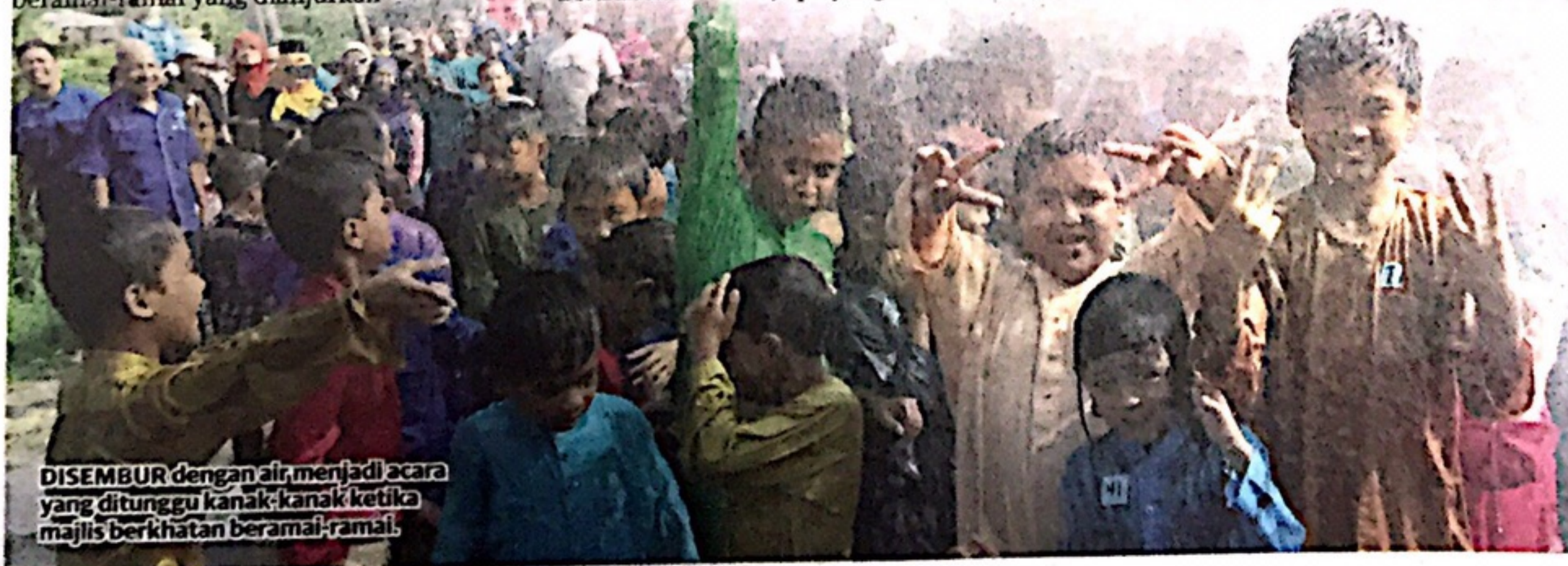
DISEMBUR dengan air, menjadi acara yang ditunggu kanak-kanak ketika majlis berkhatan beramai-ramai.

Elakkan pengalaman berkhatan menjadi satu detik hitam dalam sejarah hidup anak anda.