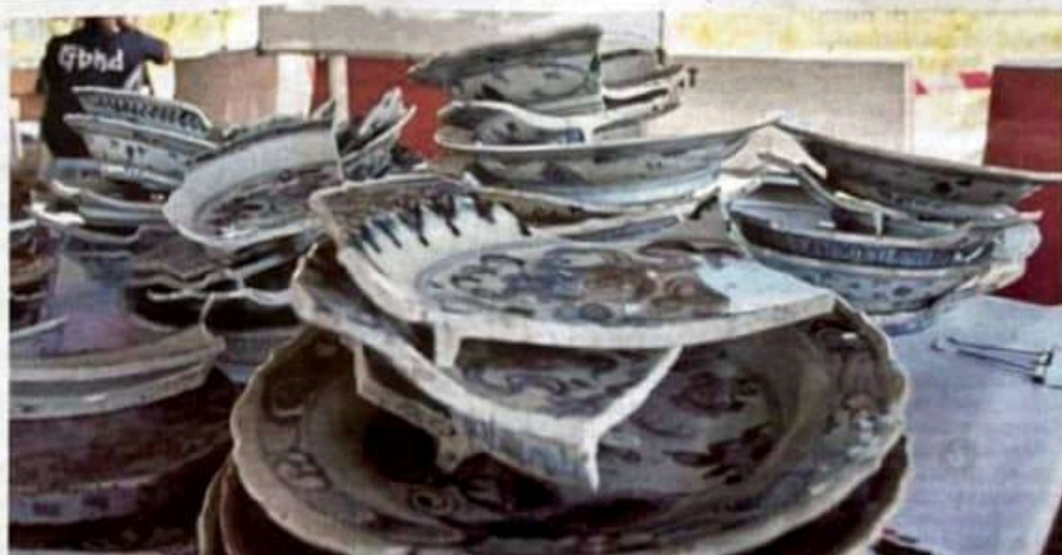
ANTARA artifak yang ditemui di perairan negara.

Mohd Azmi berkata, 10 daripada kapal karam berkenaan sudah dijalankan survei, manakala beberapa kapal lagi masih dijalankan kerja ekavasi dengan kerjasama penyelidik dari luar negara.