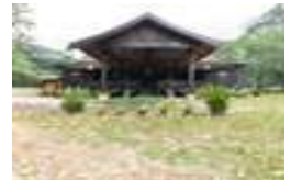
Istana Puteri Bongsu