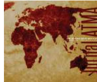
Jurnal Antarabangsa Alam & Tamadun Melayu