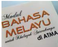
Kursus Intensif Keterampilan Bahasa Melayu (KIKBM)