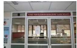
Pusat Penyelidikan Manuskrip Alam Melayu (PPMAM)