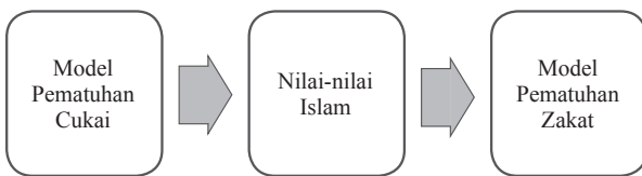
RAJAH 1. Model Pematuhan Zakat

sungguhpun pematuhan zakat boleh mengikut model pematuhan cukai tetapi pelaksanaannya perlu disesuaikan mengikut fatwa dan peraturan yang diwartakan oleh pihak berkuasa zakat. Selain itu, pematuhan zakat juga mementingkan pembayaran zakat melalui saluran yang rasmi (Zulkifli & Sanep 2011). Pematuhan ke atas zakat memenuhi dua tuntutan iaitu agama dan kehidupan dunia berbanding pematuhan cukai yang hanya mematuhi peraturan manusia untuk mengelakkan hukuman dan penalti. Sanep et al. (2011) turut mencadangkan penambahbaikan amalan pematuhan zakat dengan mengambil contoh amalan percukaian seperti Rajah 1 berikut: