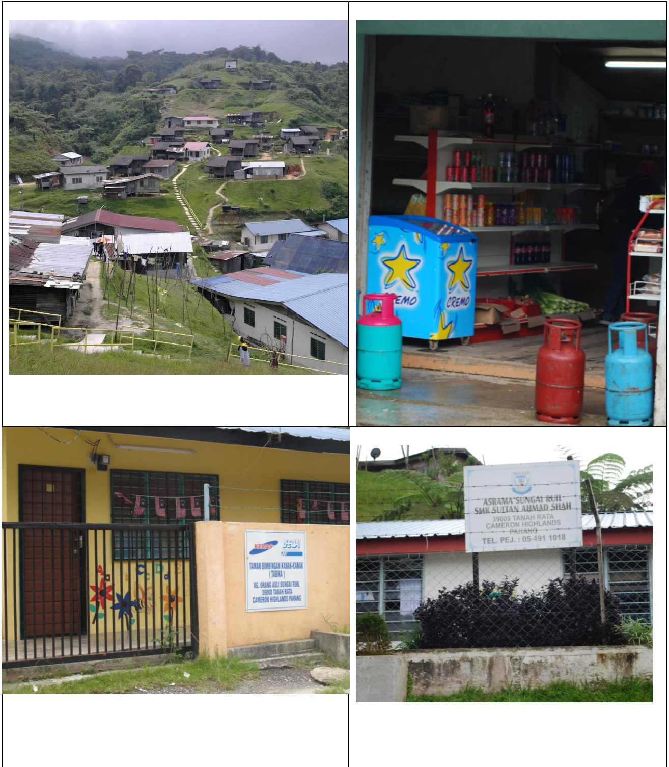
RAJAH 2: Pemandangan Sekitaran dan Rumah Penghuni Kawasan Kajian