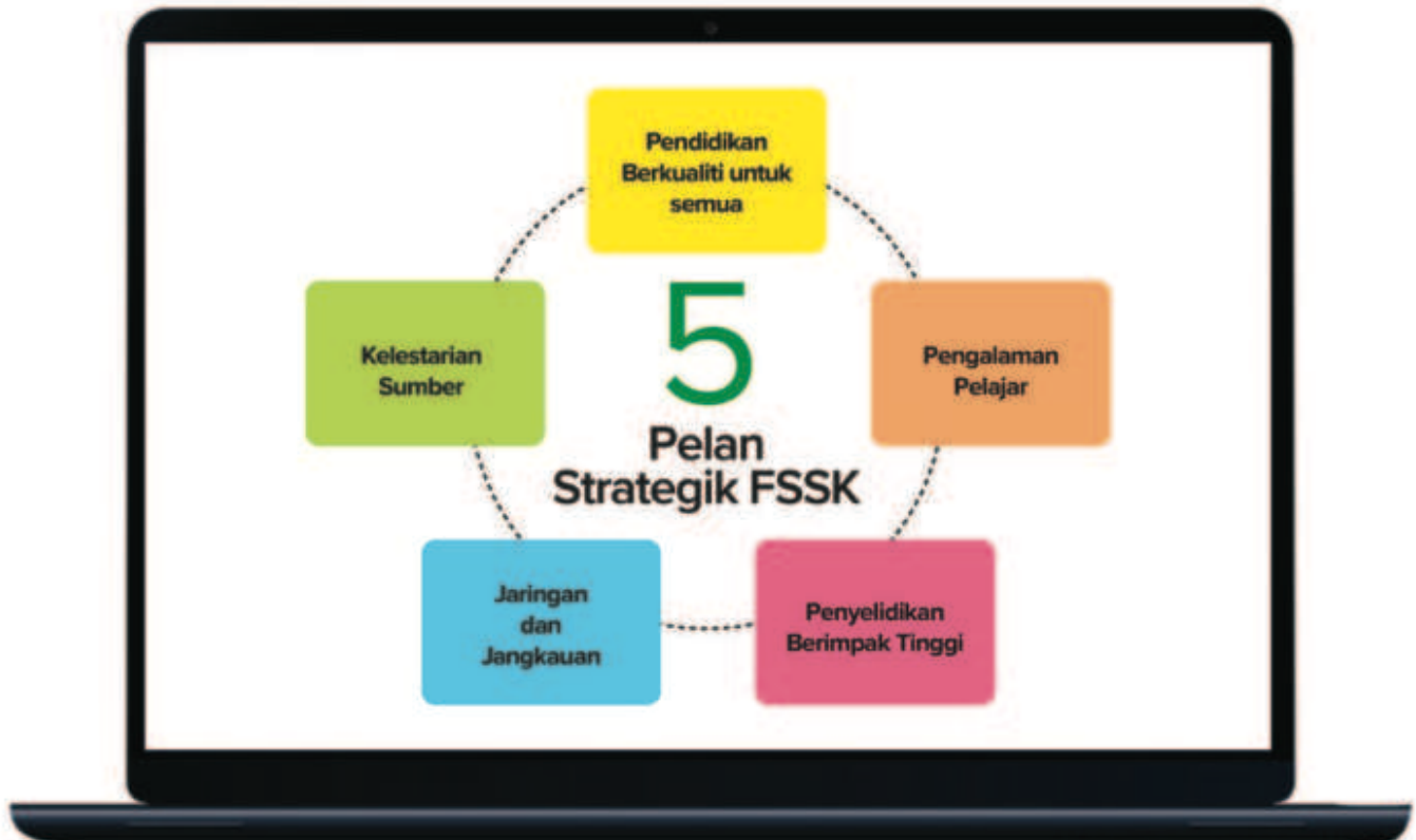
**Infografik Pelan Strategik FSSK

Umum mengetahui bahawa FSSK adalah di antara tiga fakulti yang terawal dibina di UKM dan menerusi teras keempat, kelestarian sumber dari segi pemerksaan sumber manusia, infrastruktur pendidikan dan kelestarian kewangan akan ditambahbaik dari semasa ke semasa. Ini adalah kerana FSSK akan mengutamakan penyediaan sebuah ekosistem pendidikan yang kondusif terhadap semua ahli fakulti. Dengan jumlah penajaan fakulti sebanyak RM18.3 juta, pada tahun 2022, FSSK akan memastikan agar setiap ahli fakulti menerima manfaat menerusi pemerksaan infrastruktur, rejunivasi dan motivasi untuk meningkatkan penyampaian perkhidmatan yang lebih cemerlang.