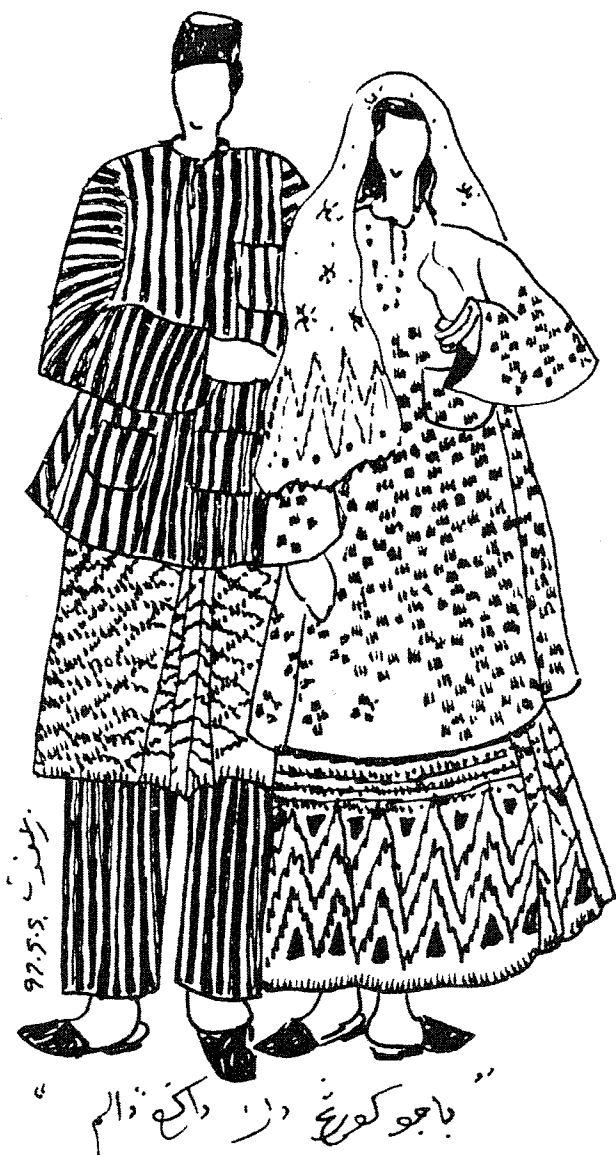
RAJAH 2. Kurung Teluk Belanga Dagang Dalam