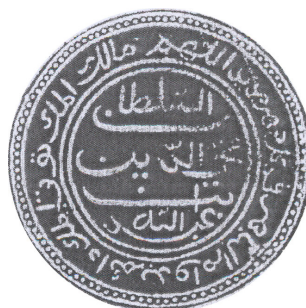
GAMBAR 3. Cap ( seal ) Sultan Muhyiuddin Abdul Gafur beserta transliterasi dan keterangan inskripsi tulisannya

‘The Sultan Muhyiuddin, son of Abdullah // “O God, Lord of Power (and Rule), You give Power” Qur’an 3.26) which lasts as long as there is light, throughout everlasting time’ Border: // read from 30° anticlockwise facing inwards Shape: circle, with a border of dots; 53 mm 3:26 5 impression(s); lampblack RUL Cod.Or.2240.Ia.15 Letter to the Gov.-Gen. and the Raad van Indië , 22 Muharam 1206 (21 September 1791) Other examples: RUL Cod.Or.2240.Ia.24, 38, 44; Cod.Or.2242.II.3