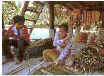
GAMBAR 3. Budaya hidup seharian menjadi teras kepada identiti seni bina tradisional Melayu