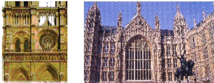
GAMBAR 5. Hiasan yang berlebihan pada seni bina Gothik di Britain pada awal kurun ke-19 dikritik hebat oleh pergerakan Arts and Crafts

melihat dan mengambil teladan daripada pembinaan bangunan vernakular atau rumah orang kampung. Mereka memuji penghasilan reka bentuk rumah kampung yang secocok dengan budaya hidup, tanpa perhiasan yang berlebihan dan susun atur ruang yang responsif terhadap aktiviti dalaman serta keadaan cuaca. Kebanyakan rumah dan bangunan vernakular itu wujud pada kurun pertengahan dengan tukang yang membinanya itu lebih berjiwa agama. Mereka juga berbangga dengan hasil kraf serta teknologi binaan berasaskan bahan-bahan setempat (Elizebeth Cumming & Wendy Kaplan 1995:11-12).