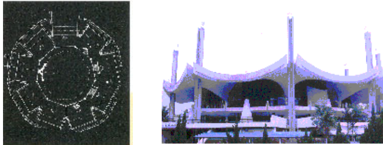
GAMBAR 4. Reka bentuk pelan Masjid Seremban (kiri) berdasarkan sembilan daerah di Negeri Sembilan; manakala bumbungnya yang melengkung (kanan) direkabentuk berdasarkan bentuk bumbung rumah rumah tradisional Negeri Sembilan

penerapan nilai seni bina Melayu ke dalam bentuk moden pada tahun 1960-an dan 1970-an akan dapat dilaksanakan dengan lebih berjaya berikutan kajian yang lebih meluas mengenainya. Kajian yang dimaksudkan itu meliputi bangunan yang belum pernah didokumentasi dan aspek yang tidak dapat dilihat pada fizikal bangunan tersebut. Misalnya, temu bual bersama arkitek yang mereka bentuk bangunan yang dikaji untuk mengetahui aspek yang diambil kira semasa mereka-bentuknya.