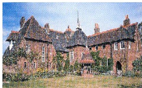
GAMBAR 6. “The Red House” rekaan Philip Web (1859) telah menggabungkan seni bina tradisi, teknologi semasa dan budaya hidup semasa. Penghasilan reka bentuk pelan lantainya (kiri) berdasarkan aktiviti seharian penghuninya