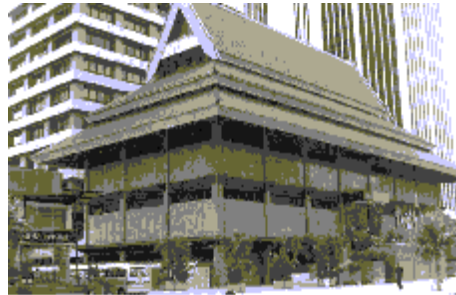
GAMBAR 2. Podium ibu pejabat BBMB, Kuala Lumpur yang direka bentuk berdasarkan reka bentuk rumah tradisi Melayu di Kelantan. Pendekatan sebegini diibaratkan sebagai “seni bina belon” kerana saiz rumah Melayu tersebut dibesarkan berkali ganda

secara terus reka bentuk rumah Melayu Kelantan dengan dibesarkannya beberapa kali ganda, sedangkan bangunan yang direkabentuk tersebut bukan lagi sebuah rumah Melayu (Mohd Tajuddin Rasdi 2001:28). Perumpamaan “belon” pada seni bina tersebut bukanlah dari segi bentuknya, tetapi keadaan fizikalnya yang dibesarkan beberapa kali ganda dari saiz yang asal.