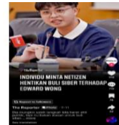
Rajah 3: Orang Awam yang mendapat kecaman di media sosial

Perkara ini menunjukkan bahawa ramai lagi masyarakat yang tidak memahami bentuk-bentuk buli siber yang sebenar dan implikasinya terhadap individu sehingga bertindak menormalisasikan dalam melontarkan pendapat masing-masing di media sosial. Sehubungan dengan itu, terdapat keperluan yang mendesak untuk meneliti dan menilai sejauh mana masyarakat Islam masa kini benar-benar memahami dan peka terhadap isu buli siber dan keperluannya dalam melindungi lima prinsip maqasid syariah.