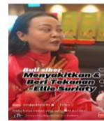
Rajah 1: Seorang pelaku meluahkan tekanan yang diterima sebagai mangsa buli siber

Wong yang menjadi mangsa buli siber akibat tindakan beliau menyatakan ketidakpuasan hati di sidang akhbar kerana gagal mendapat penempatan di Universiti Malaya (Sinar Harian 2024)