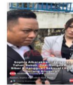
Rajah 2: Seorang pelaku yang terkesan dengan perlakuan buli siber