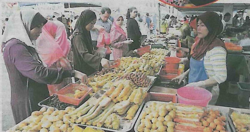
Suasana di bazar Ramadan yang jarang dapat dilihat di negara lain.