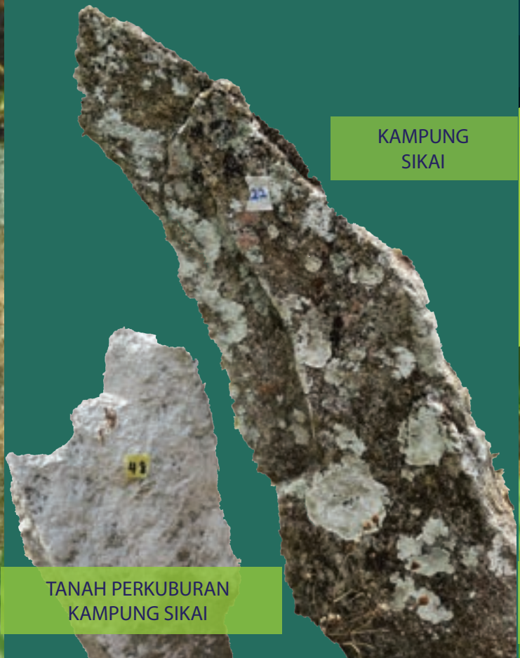
TANAH PERKUBURAN KAMPUNG SIKAI