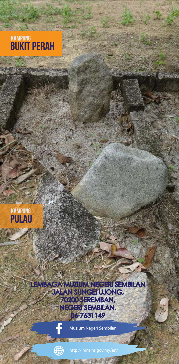
KAMPUNG BUKIT PERAH