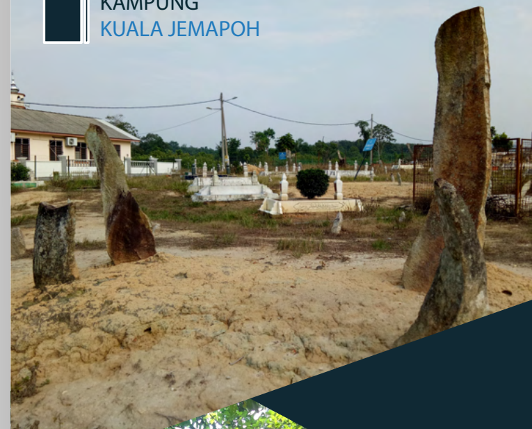
KAMPUNG KUALA JEMAPOH