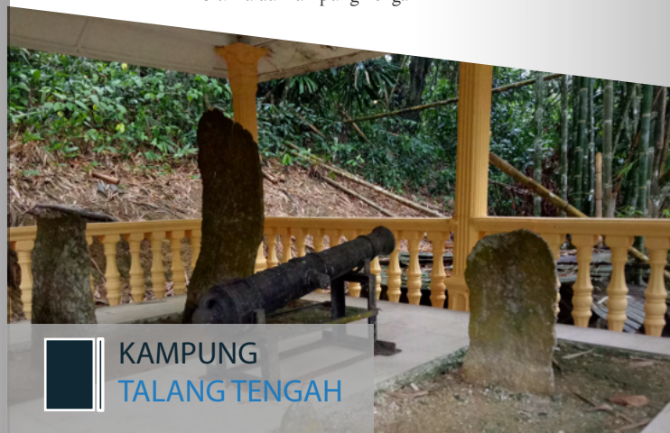
KAMPUNG TALANG TENGAH