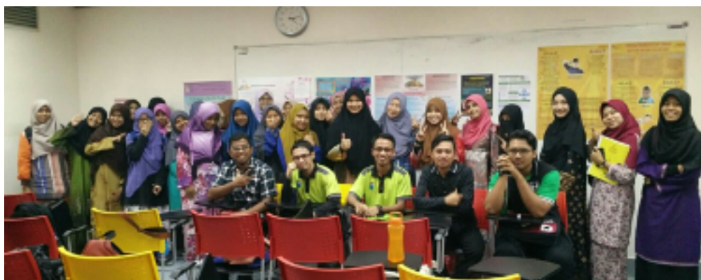
GAMBAR 1. Pelajar-pelajar Kelas Subjek MPU (sesi bentang poster)

Sesungguhnya pengalaman pengajaran dan pembelajaran subjek MPU secara blended dan active learning ini dapat menambah baik sistem penyampaian universiti dalam melengkapkan pendidikan pelajar bagi melahirkan graduan menyeluruh lagi bersahsiah dengan mempunyai jati diri yang mantap bersama peluasan ilmu pengetahuan dan penguasaan kemahiran-kompetensi insaniah bagi memenuhi keperluan semasa dan menghadapi masa hadapan yang lebih cemerlang. Pengalaman yang dibawa dan diperkongsikan dalam subjek MPU di Pusat Citra UKM ini wajar diangkat dan diperluaskan penggunaannya.