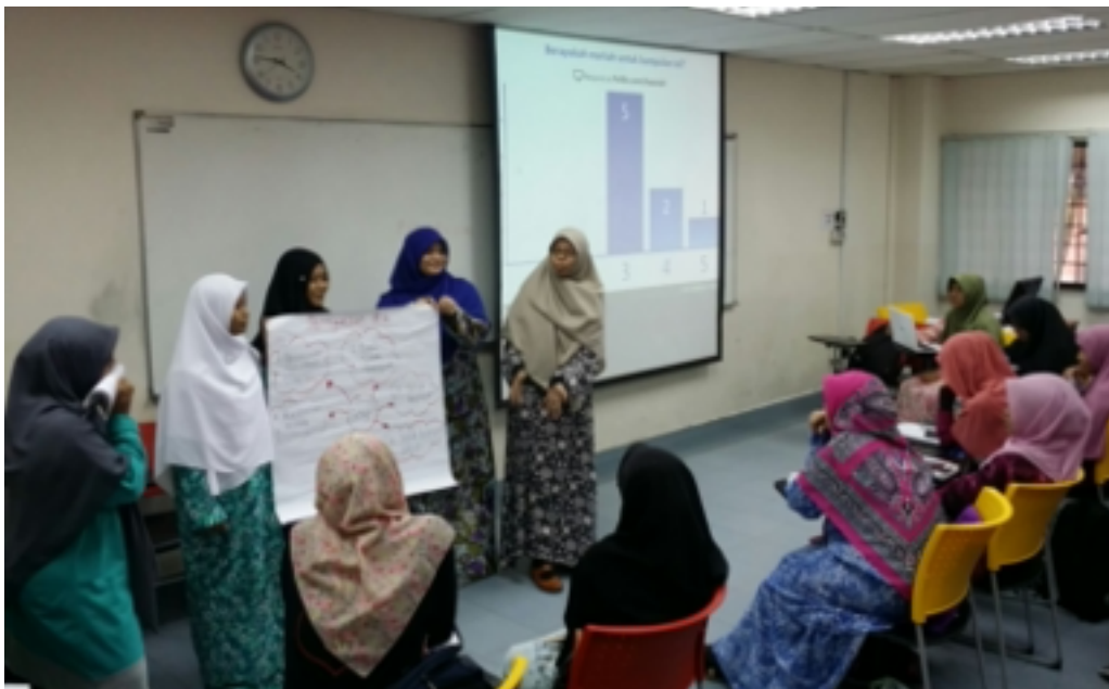
GAMBAR 3. Pelajar-pelajar (sesi blended learning)