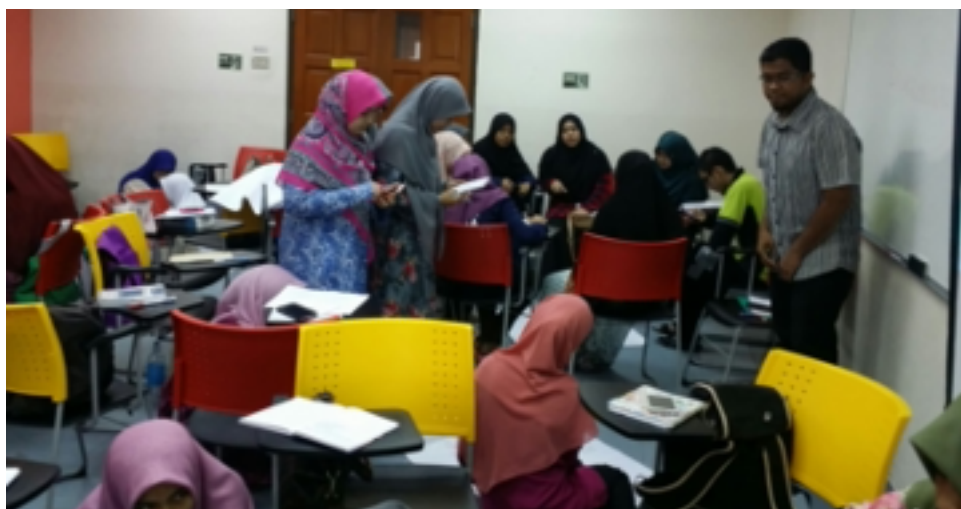
GAMBAR 4. Pelajar-pelajar (sesi perbincangan TAPPS)