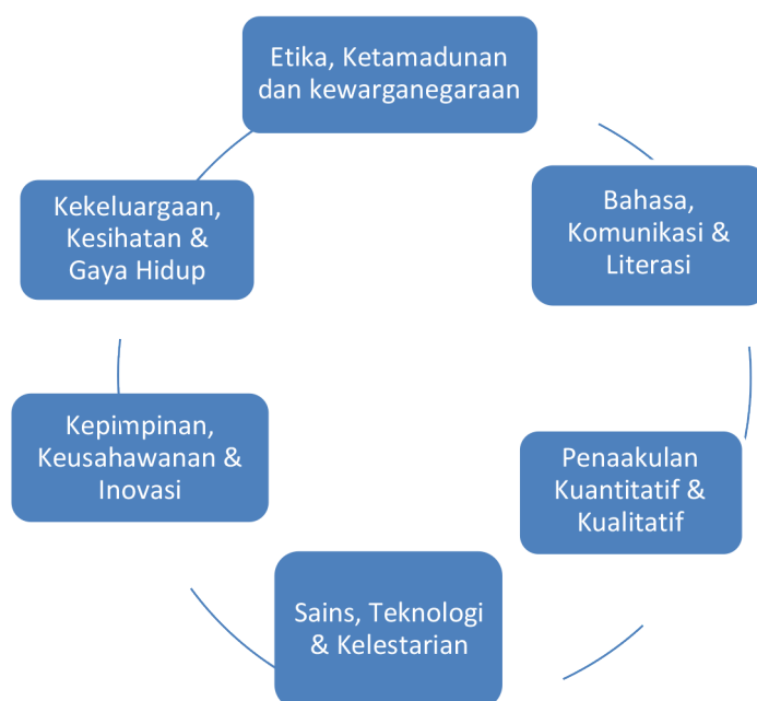
RAJAH 1. Enam Domain Pendidikan CITRA UKM

Hasil daripada kerja-kerja penyelidikan dan perbincangan yang panjang lagi komprehensif, sejumlah enam domain Pendidikan CITRA telah dikenal pasti, diperhalusi dan dipersetujui (Lihat Rajah 1) dengan sebuah Jawatankuasa Pelaksana Pendidikan CITRA UKM telah ditubuhkan bagi merancang dan menjalankan pelaksanaan Pendidikan CITRA UKM yang telah dimulakan pada Semester 2014-2015.