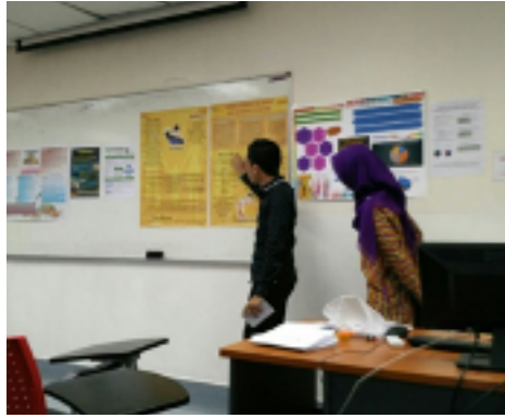
GAMBAR 2. Pelajar-pelajar Kelas MPU sedang membenteng poster