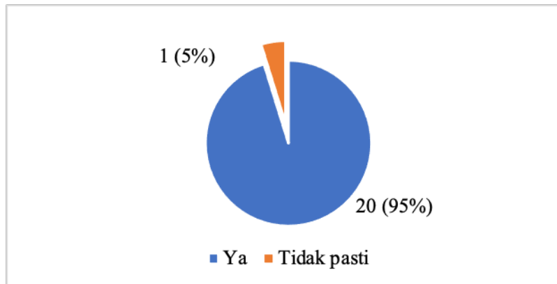
RAJAH 4. Rekomendasi Peserta Untuk Meneruskan Program Pertukaran Pelajar Secara Maya di Masa Akan Datang

Majoriti peserta, 85% (n = 18) berpuas hati dengan program yang diusahakan oleh UKM (Rajah 3). Selain itu, 95% (n=20) daripada jumlah pelajar menyarankan untuk meneruskan program maya ini di masa akan datang jika pertemuan bersemuka masih tidak dibenarkan (Rajah 4).