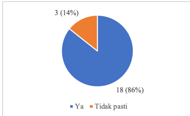
RAJAH 3. Tahap Kepuasan Peserta Dalam Program Pertukaran Pelajar UKM-BGU Secara Maya