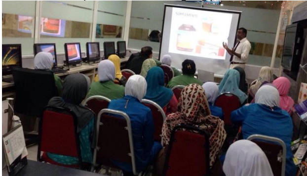
Ceramah Kesihatan UKM-MSD