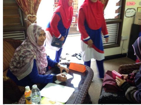
Saringan kesihatan dalam Program Sinergi Rakyat