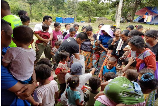
Program Khidmat Masyarakat UKM-EPIC di Pos Gob Kelantan