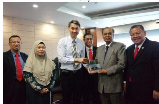
Lawatan Pengurusan PPUKM ke National University Health System (NUHS) Singapore