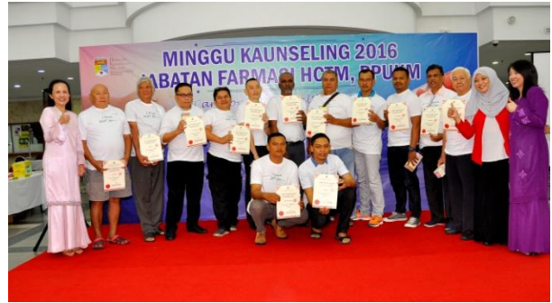
Minggu Kaunseling 2016 (Jabatan Farmasi)