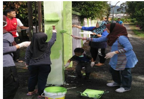
Gotong Royong Membersihkan Kawasan Maahad Tahfiz Nurul Huda (Jabatan Kejururawatan)