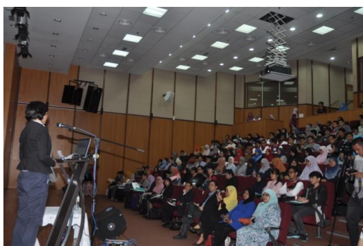
CEO@FACULTY – Novartis Corp