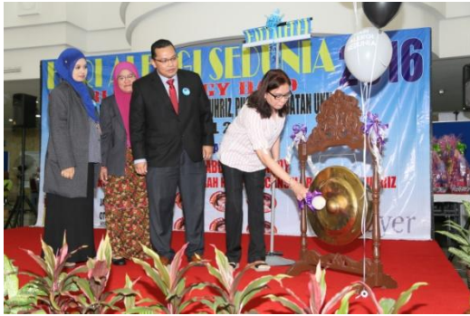
Majlis Sambutan Hari Alergi Sedunia 2016 (Jabatan Otorinolaringologi)