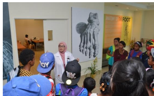
Lawatan Anak-anak Org Asli Kg.Chuweh (HEJIM, UCTC, Jabatan Anatomi)