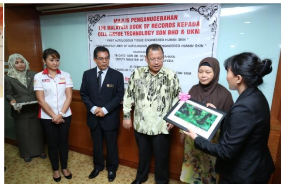
Pemeteraian MOA UKM dan Cell Tissue Technology Sdn Bhd (CTT) dalam mengkomersialkan MyDerm. (Pusat Kejuruteraan Tisu)