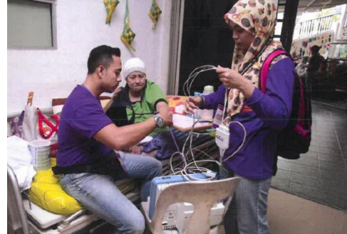
Program Tautan Kasih & Sayang 2016 (Jabatan Anestesiologi & Rawatan Intensif)