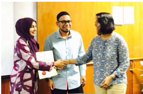
Penyampaian Sumbangan Komputer Terpakai kepada Sekolah Rendah St Mary Selayang (Jabatan Perubatan)