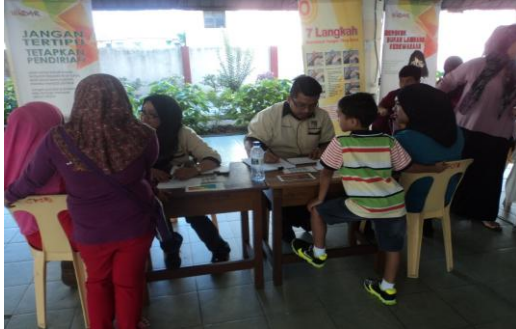
Pameran dan Pemeriksaan Kesihatan Sempena Hari Tunas Usahawan (Jabatan Perubatan Keluarga)