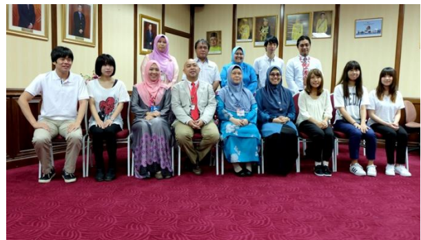
Program Mobiliti Pelajar Shiga University Medical Science (SUMS)