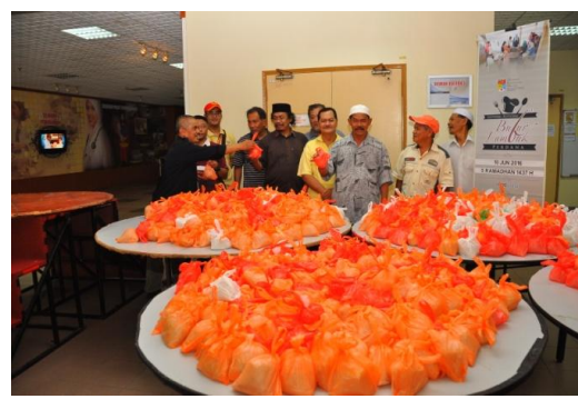
Gotong-royong Bubur Lambuk 2016 bersama penduduk (HEJIM, KESUKMA, MNA)