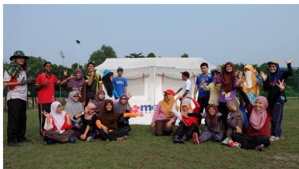
Program UKM-MERCY “Youth for Humanity” (HEJIM, Jabatan Ortopedik, Jabatan Kecemasan)