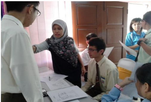
Khidmat Masyarakat Di Sekolah Menengah Kebangsaan Taman Seraya, Ampang (Jabatan Perkhidmatan Pemulihan Perubatan)