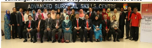
Lawatan Delegasi LPU, MITI, MIDA ke PPUKM