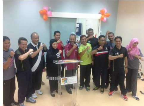
Seminar Aktiviti Fizikal (Jab. Kesihatan Masyarakat, Jab. Maklumat Kesihatan dan HEJIM)