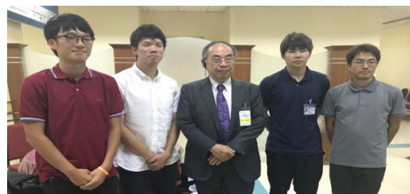
Foto 3 - Pelajar Sangkutan daripada SUMS

Kejururawatan. PPUKM juga telah menghantar 2 orang pelajar perubatan dan 3 orang pelajar kejururawatan ke SUMS Jepun