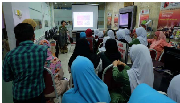
Jadual 6 : Berikut adalah senarai program ceramah kesihatan UKM-MSD

Program Ceramah Kesihatan UKM-MSD merupakan salah satu aktiviti kerjasama antara UKM dan Merck Sharp and Dohme. Objektif program ini adalah untuk memberi pendedahan kepada pesakit, orang awam dan kakitangan PPUKM dalam mengetahui punca-punca penyakit, cara rawatan dan menangani penyakit. Penceramah jemputan adalah terdiri daripada doktor-doktor PPUKM yang mempunyai kepakaran tertentu. Berikut adalah jadual ceramah yang telah dijalankan sepanjang tahun 2017.