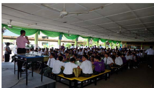
Foto 5 - Taklimat kesihatan di SMK Taman Seraya

Sekolah@UKM adalah penjenamaan unik dari UKM dengan kerjasama. Program yang dianjurkan atas nama UKM bersama dengan sekolah atau yang melibatkan dengan sekolah, akan menggunakan penjenamaan yang sama. Di peringkat PPUKM, kerjasama dengan sekolah telah terjalin sejak sekian lama terutamanya dari segi perkhidmatan kesihatan, pameran, dan lain-lain. Sebanyak 17 aktiviti PPUKM bersama sekolah sepanjang tahun 2017.