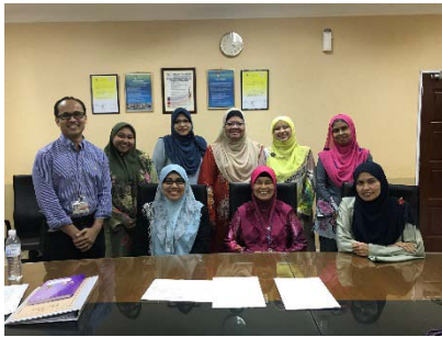
Foto 1 - Mesyuarat dengan Politeknik Shah Alam

Setiap bulan sekurang-kurangnya 2 perjumpaan atau mesyuarat diadakan bersama pihak luar untuk membincangkan kerjasama yang boleh dijalankan. Objektif perjumpaan yang diadakan adalah berbeza namun perbincangan menjurus kepada kerjasama program kemasyarakatan, pelajar sangkutan, kursus/bengkel, perkongsian kepakaran, penyelidikan dan perkhidmatan.