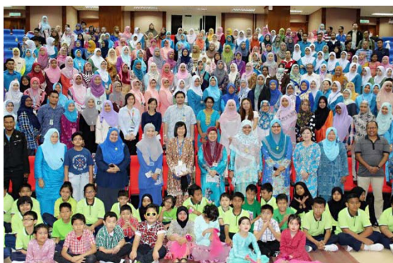
Foto 3 - Hari Kesedaran Autism Peringkat PPUKM

Pusat Perubatan UKM banyak membuat program dengan kerjasama luar dan juga menerima lawatan-lawatan luar sepanjang tahun 2016. Sebanyak 70 program dan lawatan yang melibatkan pihak luar telah dijalankan. Program yang banyak dijalankan bersama pihak luar adalah berbentuk kempen kesedaran dan komuniti. Manakala lawatan pula sama ada lawatan akademik ataupun lawatan kerja. Jadual di bawah adalah senarai program Lawatan Jaringan Akademik, Industri dan Komuniti.