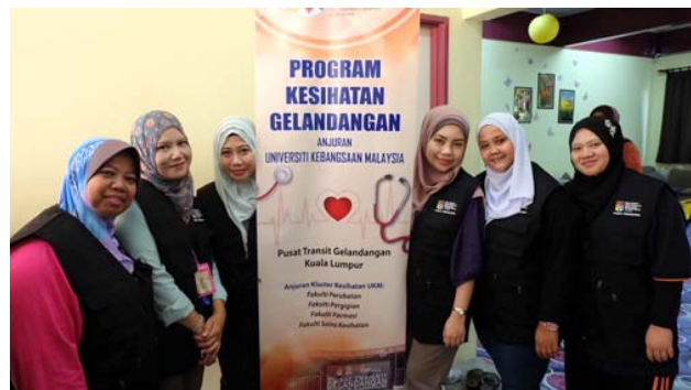
Foto 2 - Program Kesihatan Gelandangan UKM

Program khidmat masyarakat banyak digerakkan oleh jabatan-jabatan untuk kakitangan di jabatan tersebut. Permohonan aktiviti bersama komuniti/industry/sekolah yang melalui borang HEJIM pada tahun ini adalah sebanyak 78 berbanding dengan tahun lepas yang hanya sebanyak 41 sahaja. Kebanyakannya aktiviti yang dijalankan di rumah kebajikan warga emas, rumah anak yatim, sekolah, dan kawasan tumpuan awam. Aktiviti yang diadakan ialah gotong-royong, saringan kesihatan, pameran dan ceramah kesihatan, pemberian sumbangan, dan aktiviti ramah mesra.