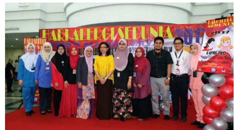
Foto 4- Hari Alergi Sedunia

Program khidmat masyarakat adalah program kebajikan yang dilakukan untuk meningkatkan kesejahteraan komuniti atau kumpulan sasaran. Pada tahun ini sebanyak 77 program dihantar untuk kelulusan HEJIM berbanding dengan tahun lepas, hanya 41 permohonan sahaja. Berikut adalah senarai aktiviti yang dihantar kepada HEJIM:-