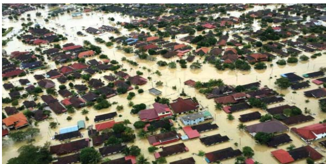
Gambar 1: Pahang dan Kelantan adalah antara negeri Pantai Timur yang paling teruk dilanda banjir ketika musim monsun 2014.

Untuk beberapa tahun kebelakangan ini, Malaysia telah mengalami isu banjir besar yang agak mencabar. Jika dilihat secara logik, kekerapan hujan di Malaysia bukanlah satu isu alam yang luarbiasa kerana Malaysia memang terletak di zon khatulistiwa. Justru itu, sudah dimaklumi bahawa pada setiap musim monsun, angin monsun timur laut akan membawa hujan yang lebat ke negeri-negeri terutama di Pantai Timur Malaysia serta juga ke Sabah dan Sarawak. Angin monsun ini membawa hujan yang lebat untuk beberapa hari secara berterusan lantas membawa kepada banjir besar seperti yang pernah berlaku pada tahun 1967 dan 1971 (Ishak dan Mohamed Dali 2014). Pada ketika itu, antara alasan yang sering diutarakan tentang kejadian banjir besar berlaku adalah kerana 'kelemahan infrastruktur yang menyebabkan saluran yang ada tidak mampu menampung hujan dalam kuantiti yang banyak.' 'Kurangannya pembangunan' dijadikan alasan utama kepada banjir berlaku pada tahun 1967 dan 1971 tapi untuk banjir 2014 baru-baru ini – hampir kesemua lapisan masyarakat menyalahkan pembangunan yang tidak seimbang sebagai sebab utama banjir besar ini berlaku.