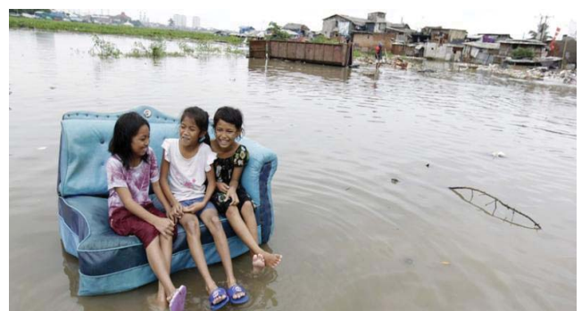
Gambar 3: Kanak-kanak seringkali kurang peka dengan keselamatan mereka sendiri

Tinjauan literatur mengenai pengurusan risiko banjir di Vietnam (Mekong River Commission, 2009) juga ada merekodkan bahawa dengan segala usaha proaktif dilakukan, tahap kemalangan golongan kanak-kanak masih meningkat di Delta Mekong setiap tahun. Walaupun sudah terdapat pelbagai usaha seperti memberi kelas berenang, pengagihan jaket keselamatan dan kempen meningkatkan kesedaran di kalangan kanak-kanak, kemalangan jiwa akibat bencana banjir di kalangan kanak-kanak tetap berlaku. Keadaan ini terus berlaku disebabkan perkara yang berkaitan dengan tabiat semulajadi kanak-kanak iaitu mereka sentiasa menjadi 'adventurous' dan kadang-kadang terlalu 'hyperaktif' sehingga mereka terlupa dengan keadaan merbahaya kepada diri mereka sendiri. Namun, isu ini tidak terlalu susah untuk difahami terutama rakyat Malaysia ketika ini. Kita masih belum lupa dengan kejadian sedih yang melibatkan tujuh pelajar anak Orang Asli yang hilang di Pos Tohoi, Gua Musang, Kelantan baru-baru ini. Anak-anak ini masih lagi kecil dan terlalu mentah untuk menjadi 'terlalu peka' dengan aspek keselamatan diri mereka sendiri.