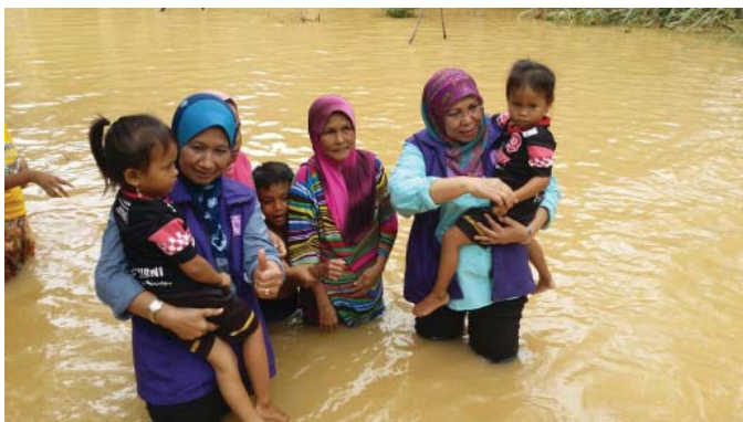
Gambar 4: Golongan wanita akan terjejas dalam pelbagai segi ketika banjir

Menurut Walker (1994), wanita akan terjejas oleh bencana banjir dari pelbagai segi. Sebagai contoh, bukan sahaja dalam peranan reproduktif wanita akan terkesan tetapi begitu juga dengan peranan mereka sebagai penjaga ekonomi dan penyelia keluarga mereka. Golongan wanita akan kehilangan kapasiti pendapatan semasa bencana banjir dan mereka bimbang mungkin berlaku pengangguran dan kekurangan pendapatan dalam keluarga mereka. Golongan wanita, terutama para isteri akan mempunyai masalah dalam pengurusan rumah tangga mereka jika tanpa sokongan mantap dari golongan lelaki.