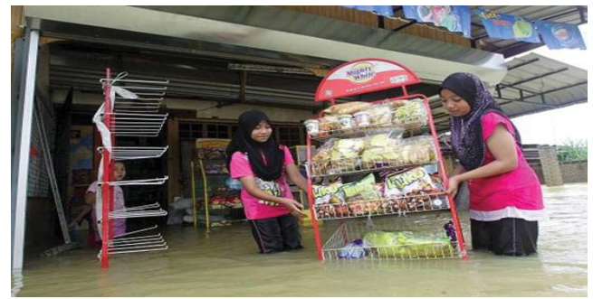
Gambar 2: Wanita dan kanak-kanak paling terkesan dengan musibah banjir

Kajian mengenai banjir menunjukkan bahawa golongan wanita dan kanak-kanak adalah golongan paling berisiko dalam menghadapi banjir. Sebagai contoh, satu kes banjir yang pernah berlaku di Vietnam menunjukkan bahawa kanak-kanak adalah peratus mangsa banjir paling terbesar. Ini adalah kerana anak-anak kecil mudah terpisah daripada ibubapa mereka semasa krisis banjir dan mereka mudah dihanyutkan dalam keadaan kelamkabut semasa banjir. Semasa bencana banjir tahun 2002 di Vietnam, ramai kanak-kanak terkorban bukan kerana tenggelam dalam banjir tetapi mereka terperangkap dan meninggal dunia di rumah masing-masing atau ketika sedang dalam perjalanan ke sekolah (Mekong River Commission, 2009). Sehubungan dengan itu, kerajaan Vietnam mula mengadakan pelbagai latihan keselamatan banjir termasuk aktiviti berenang. Mereka telah mula memasukkan aktiviti-aktiviti ini sebagai latihan pengajaran untuk kanak-kanak ke dalam kurikulum sekolah mereka.