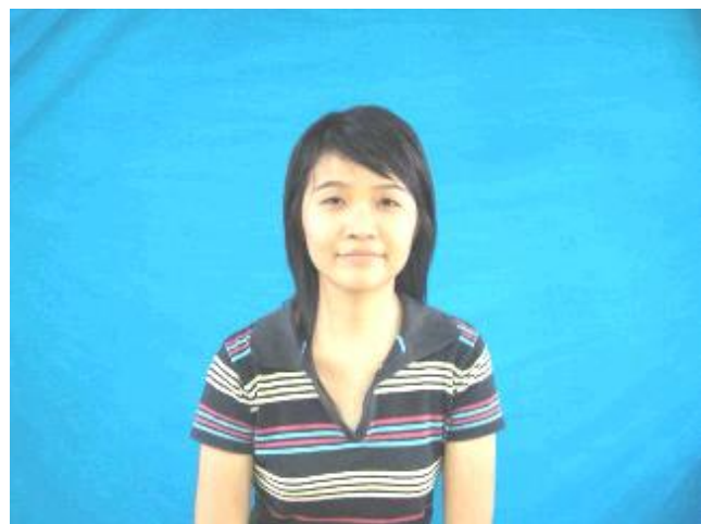
Saiz gambar yang terlalu besar akan melambatkan proses penghantaran dan memenuhi ruang server