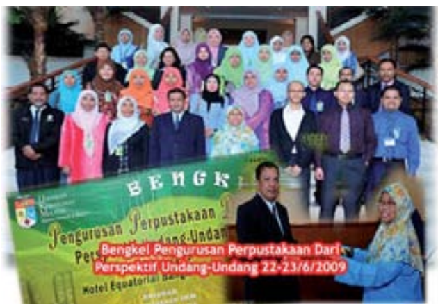
Bengkel Pengurusan Perpustakaan Dari Perspektif Undang-Undang 22-23/6/2009