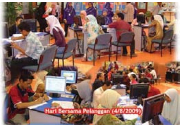
Hari Bersama Pelanggan (4/8/2009)