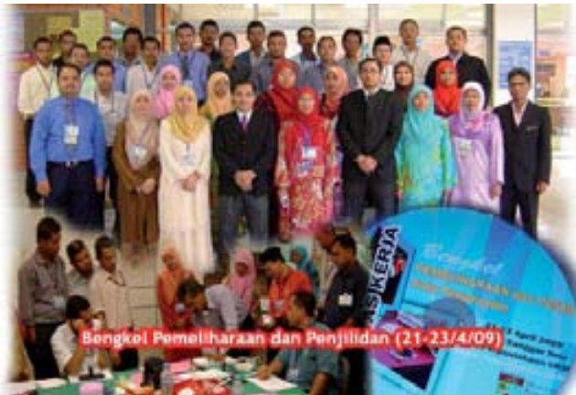
Bengkel Pemeliharaan dan Penjilidan (21-23/4/09)