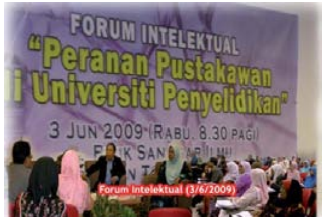
Forum Intelektual (3/6/2009)