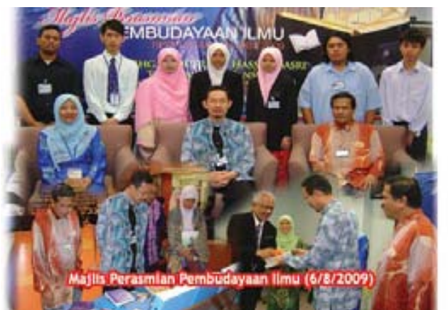
Majlis Perasmian Pembudayaan Ilmu (6/8/2009)