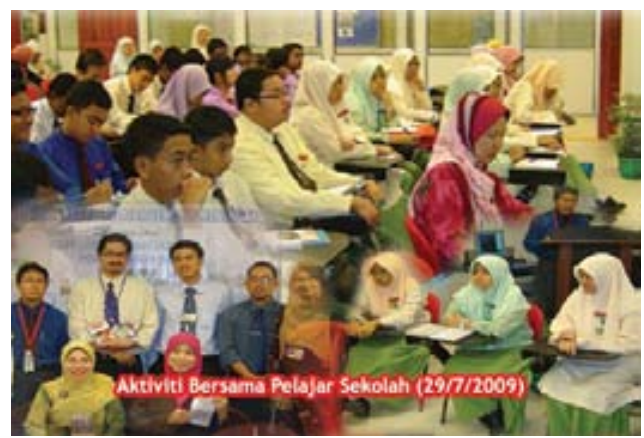
Aktiviti Bersama Pelajar Sekolah (29/7/2009)