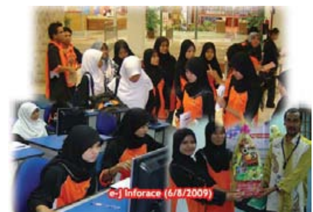
e-J Inforace (6/8/2009)