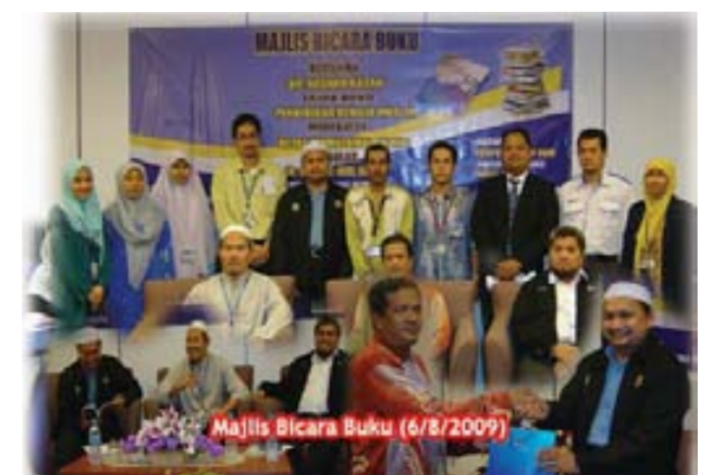
Majlis Bicara Buku (6/8/2009)